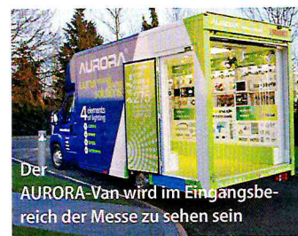
Der AURORA-Van wird im Eingangsbereich der Messe zu sehen sein