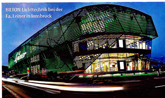
BILTON-Lichttechnik bei der Fa. Leiner in Innsbruck