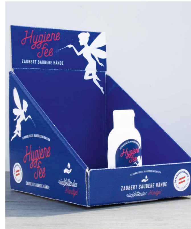
DISPLAY AUF ANFRAGE